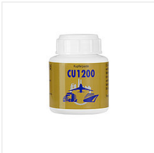
Art. Nr. 810 800 Pinseldose 140 gr.