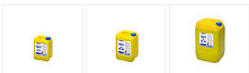
Art. Nr. 821 005