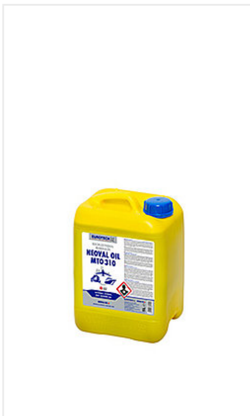
Art. Nr. 821 005 Kanister 5 Lt.