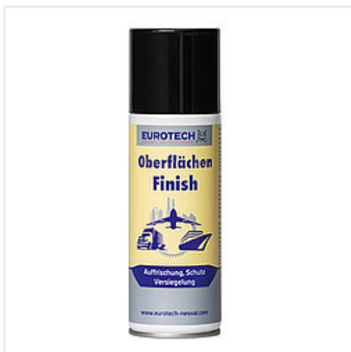
Art. Nr. 836 200 Aerosoldose 200 ml